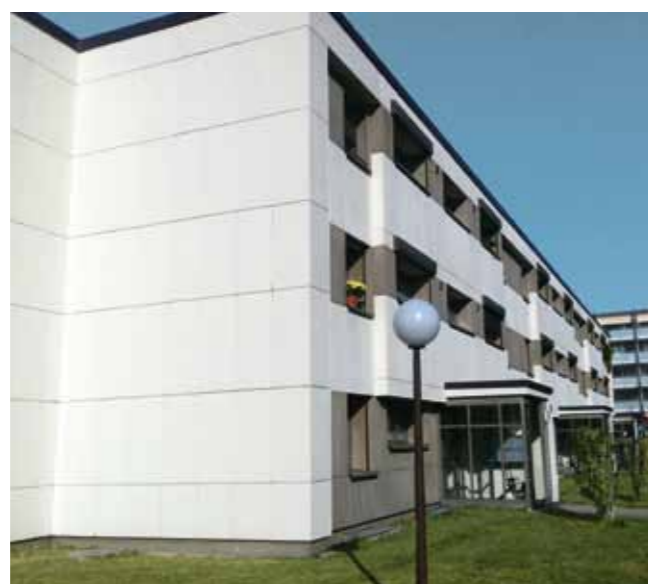
Aus dem hässlichen grauen Entlein wurde wieder ein schöner Schwan – Die Fassaden nach erfolgter Reinigung

Text: Nicole Florin, Karl Egli