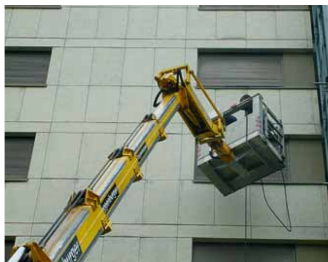
Die Fassadenreiniger bei der Arbeit

Unzählige schwarze oder vermooste Stellen, die sich über die Jahre an den Fassaden gebildet hatten, sind verschwunden. Die Reinigung mit Hochdruck (Kaltwasser) hat der Siedlung sichtbar gut getan und ihr das Aussehen früherer Tage zurück gebracht. Die Fotos auf dieser Seite geben einen guten Eindruck der markanten Veränderungen.