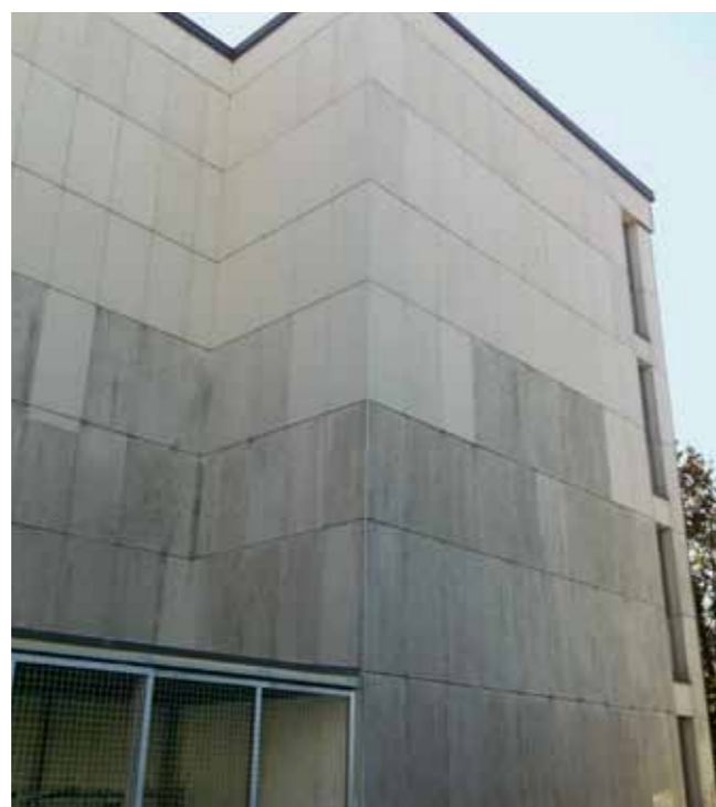
Der obere Teil ist bereits gereinigt – Der Unterschied zum unteren Teil ist frappant