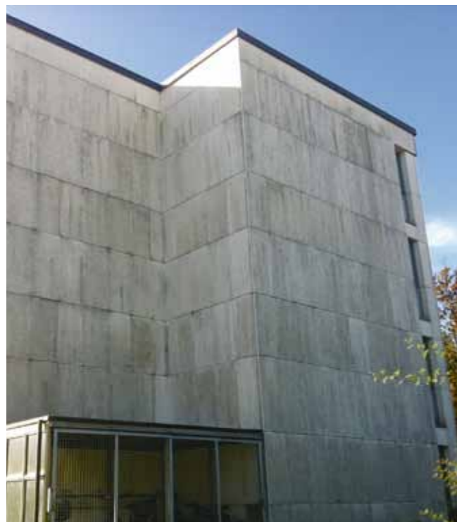
Zustand der Fassaden vor der Reinigung

2 Pflege und Erhalt der Liegenschaften ist ein stetes Anliegen der Baugenossenschaft Rotach. Diesen Herbst führte die Firma Profi Clean GmbH an allen Häusern der Siedlung Obermatten- / Tempelhofstrasse in Rümlang eine Fassadenreinigung durch. Das Resultat kann sich sehen lassen und wird nicht nur die Bewohnerinnen und Bewohner erfreuen.