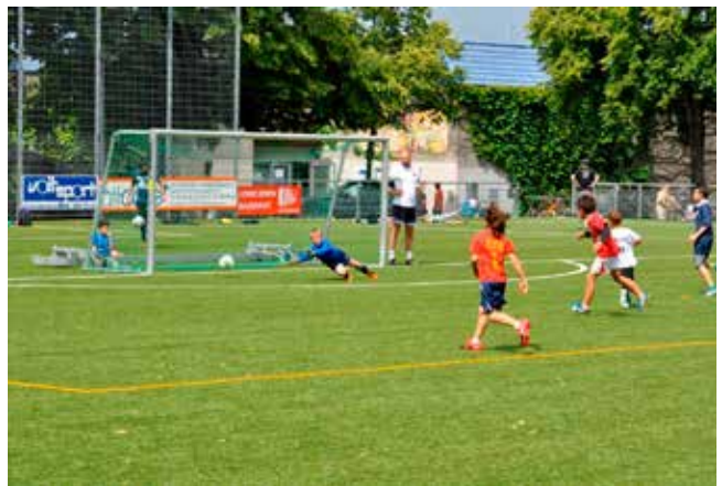
Der Nachwuchs der SpVgg erzielt das erste ihrer neun Tore ...