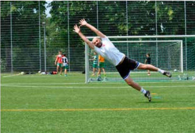
Big Tom's unverwechselbarer Stil...

Am Ende stand's 9:2 für die SpVgg Rotach; einmal hatten ihre Juniorinnen und Junioren verloren und einmal hatten ihre Senioren verloren. Die beiden Matches waren vorbei und hatten allen riesigen Spass gemacht.