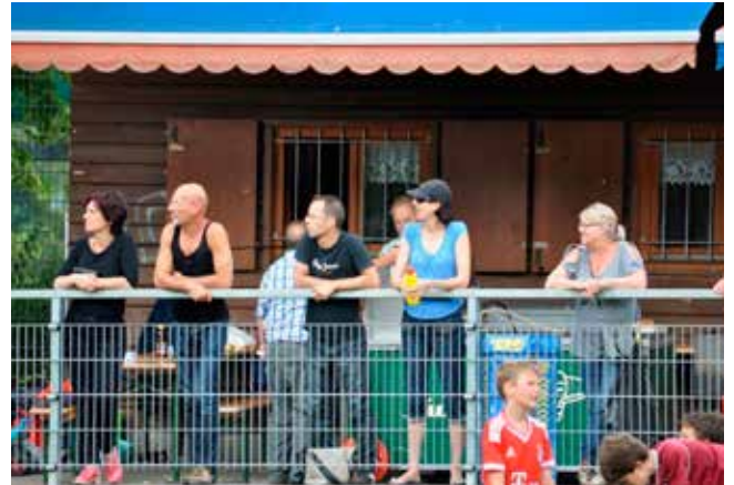
...versetzt so manchen Fan ins Staunen.

Am Ende stand's 9:2 für die SpVgg Rotach; einmal hatten ihre Juniorinnen und Junioren verloren und einmal hatten ihre Senioren verloren. Die beiden Matches waren vorbei und hatten allen riesigen Spass gemacht.